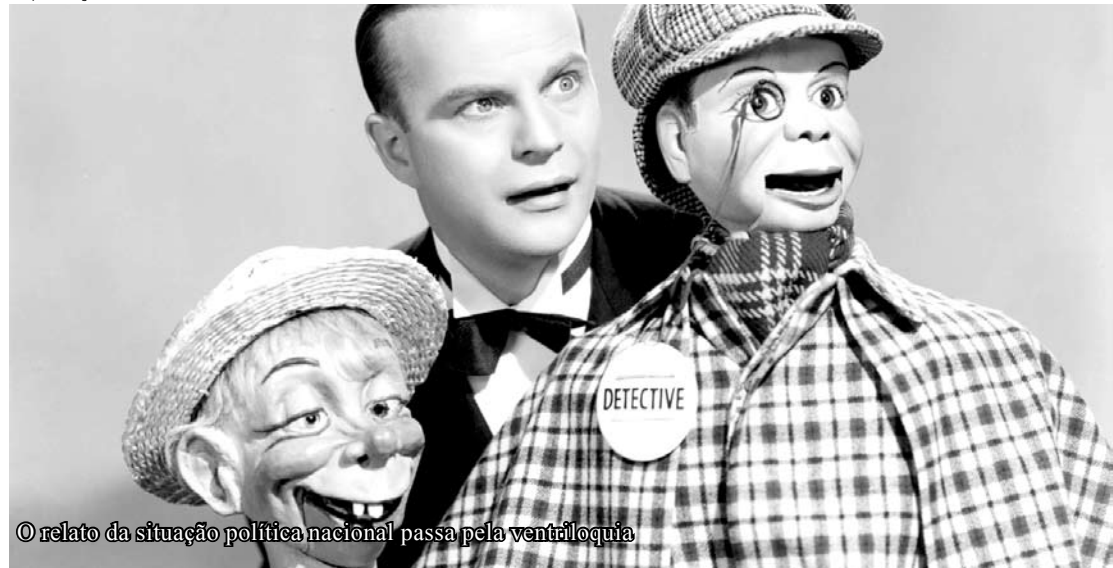
© relato da situação política nacional passa pela ventriloquia

Ventriloquia é a arte de projetar a voz, sem que se abra a boca ou movam-se os lábios, de maneira que o som pareça vir doutra fonte diferente do falante. O ventríloquo usa do artifício de falar, ao mesmo tempo que manipula um boneco. Alguns programas televisivos chegaram a apresentar bonecos “falantes”. Com esta introdução, analiso a política nacional e seus representantes da atualidade que são a presidente Dilma Rousseff, e os pré-candidatos ao cargo na próxima eleição, o governador de Pernambuco, Eduardo Campos (PSB), e o senador Aécio Neves (PSDB). Não sei se você já percebeu, mas todos os pré-candidatos acima citados têm um padrinho político e que atua como os ventríloquos da política nacional.