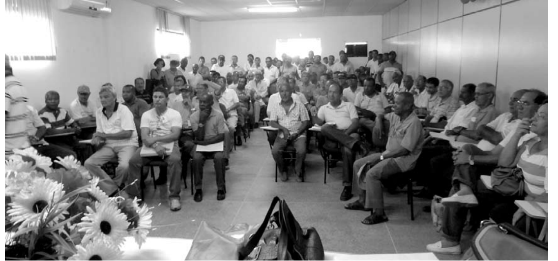
A reunião tratou do impacto causado pelos descontos da Caixa de Pecúlio nos salários dos servidores

Indignados com a mudança de custeio do plano de saúde, os servidores da Fundação Nacional de Saúde (Funasa) e do Ministério da Saúde se reuniram em Itaberaba. O encontro aconteceu no dia 20 de fevereiro no auditório da 18ª Dires e contou com a presença do gerente regional da Caixa de Pecúlio dos Servidores Públicos Federais (Capesesp).