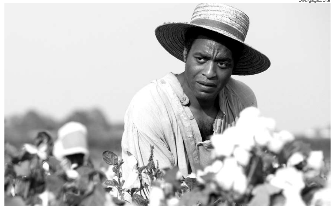
Negros eram mercadorias e forçados a trabalhar nas lavouras dos grandes fazendeiros brancos

Filme retrata a escravidão nos Estados Unidos