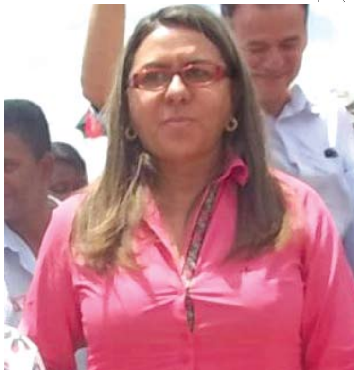
A prefeita Lenise é acusada de uma série de irregularidades

Vale lembrar também que tramita no Tribunal Regional Eleitoral (TRE-BA) um recurso eleitoral de n.º 250.2013.605.0168, contra a prefeita Lenise Campos Estrela, pelo uso indevido de recursos de campanha em favor da campanha de candidatos não coligados; gastos excessivos de combustíveis; realização de despesas não declaradas, recebimento de doação acima do limite. ■