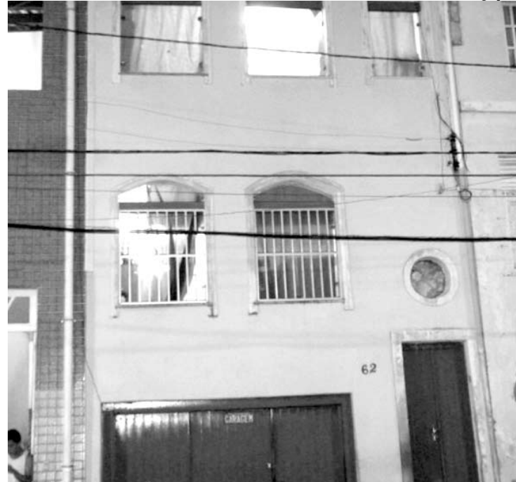
A Casa de Estudantes de Nova Redenção, em Salvador

Três vereadores de Nova Redenção já declararam apoio