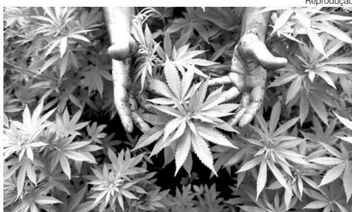
PL prevê a implantação da política de uso da maconha no país