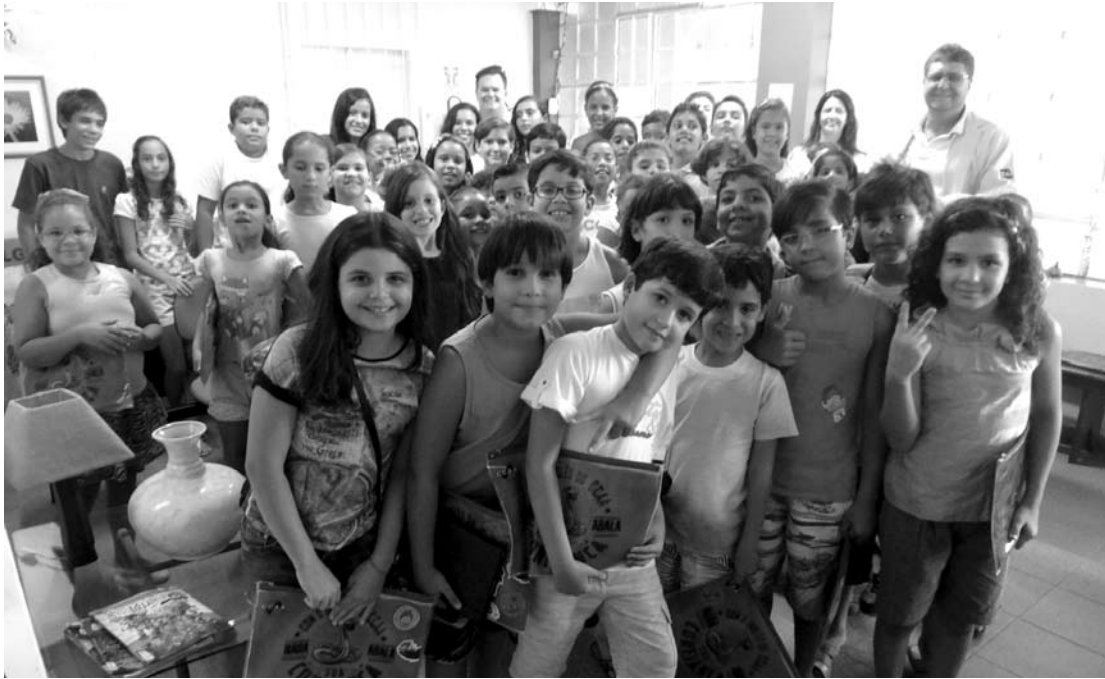
Alunos do CCAA estão motivados com o início das aulas e aguardam novas ações

O inglês está em todo lugar. No nome de lojas e produtos, nas músicas que tocam nas rádios, nos programas que assistimos na televisão e, claro, na internet. Devido à grande importância do inglês para o mercado de trabalho, os pais estão cada dia mais