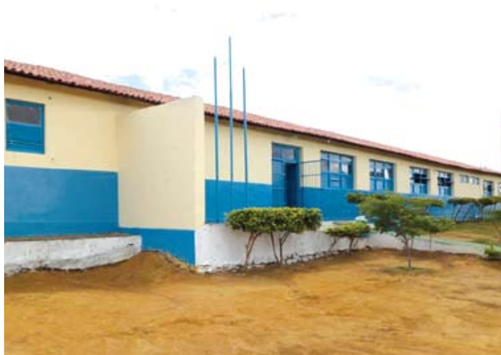
Escola Aldalgisa Martins foi entregue totalmente reformada

O ano letivo de 2014 foi iniciado no dia 3 de fevereiro no município de Wagner. Este ano, além da realização da Jornada Pedagógica, a prefeitura entregou as escolas municipais totalmente reformadas, apresentando aos alunos e professores espaços físicos em boas condições de funcionamento. Todas as unidades de ensino, inclusive a creche da pré-escola, receberam ações nas partes elétrica e hidráulica, telhado, piso, banheiros, pintura, iluminação, entre outras.