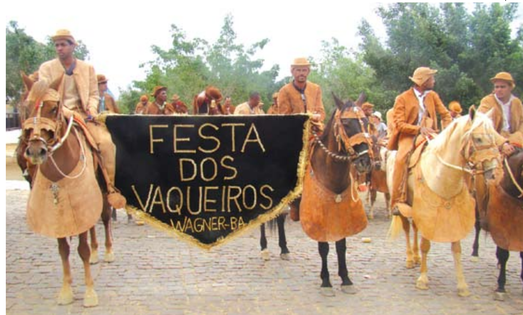
Competidores de toda a região da Chapada Diamantina estão aguardando o tradicional evento