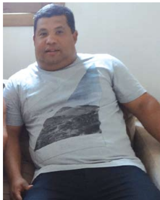
Representantes do povo na Câmara de Vereadores apontam desmandos na gestão municipal

Os vereadores cobram ainda da prefeita esclarecimentos sobre a aplicação dos recursos do Fundo Nacional de Educação Básica (Fundeb). “Os recursos do Fundeb são transferidos para os municípios para serem gastos 60% com pagamento de salários de professores e 40% com os demais funcionários da área de educação, como serventes, merendeiras, seguranças, transporte escolar, dentre outros. Ocorre que, no ano de 2012, os recursos do Fundeb foram menores e o gestor público da época efetuou um rateio entre os professores, e no ano de 2013 os recursos foram maiores, mas a prefeita não fez o rateio e ainda fez vá-