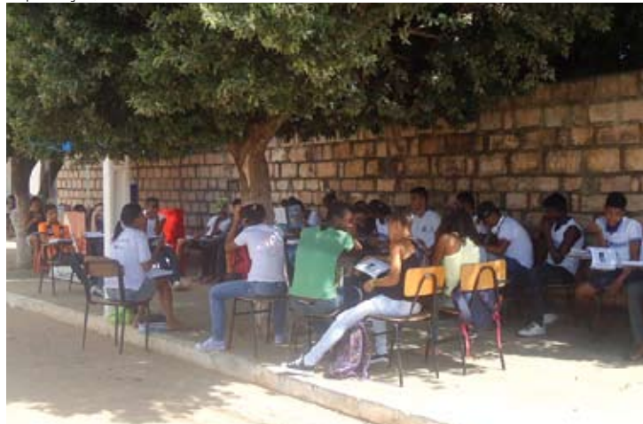
Alunos do povoado de Tanquinho têm aulas embaixo de árvore