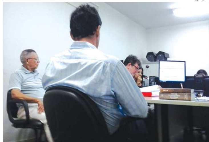
O processo retorna para o TJ/BA onde será analisado