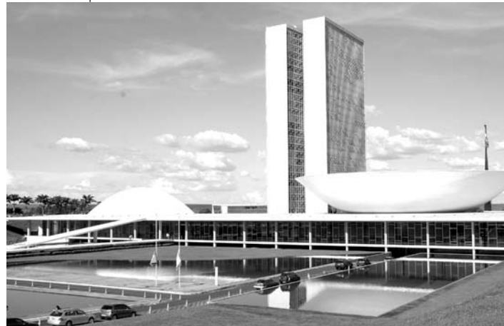
O feriado de Carnaval do congresso teve duração de 13 dias

Com apenas seis projetos aprovados em quatro semanas de votações, a Câmara dos Deputados e o Senado tiveram, até então, o pior nível de produção em dez anos. O resultado foi influenciado, principalmente, por embates entre o Palácio do Planalto e sua base de apoio, e deve sofrer abalo ainda maior com