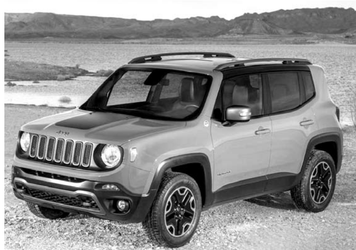
A Chrysler estuda se o nome Renegade será adotado no país

A principal novidade mundial da Fiat Chrysler neste início de 2014 é o Jeep Renegade, que faz sua estreia no Salão de Genebra, evento que foi até o dia 16 de março, na Suíça. Além de ser passo importante