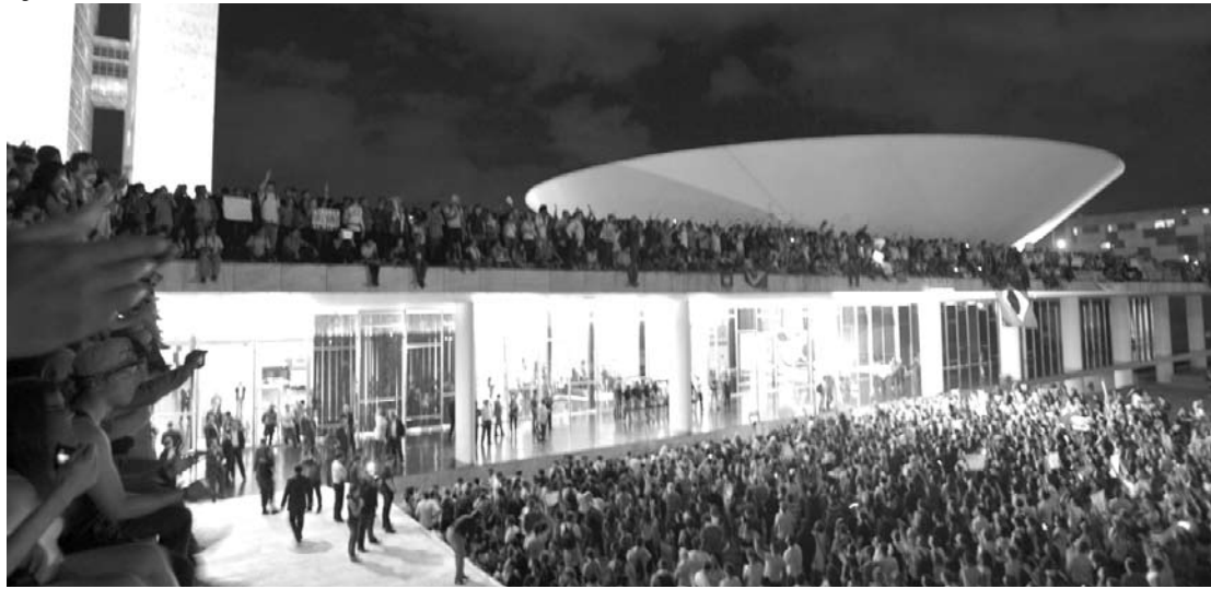
Durante os atos de junho de 2013, parte do Congresso Nacional foi ocupado por manifestantes

Em meio a manifestações ocorridas na Ucrânia e na Venezuela, autoridades da ONU e especialistas em direitos humanos afirmaram que os governos devem facilitar as manifestações em vez de criminalizá-las. O alerta ocorre em um momento de frequentes manifestações contra a Copa do Mundo no Brasil e em que autoridades do país discutem um eventual endurecimento das leis para punir manifestantes violentos. Em relação ao Brasil, os especialistas, que participavam de um debate nesta semana na Universidade de Genebra, criticaram o fato de que os policiais acusados de abusos em protestos são investigados