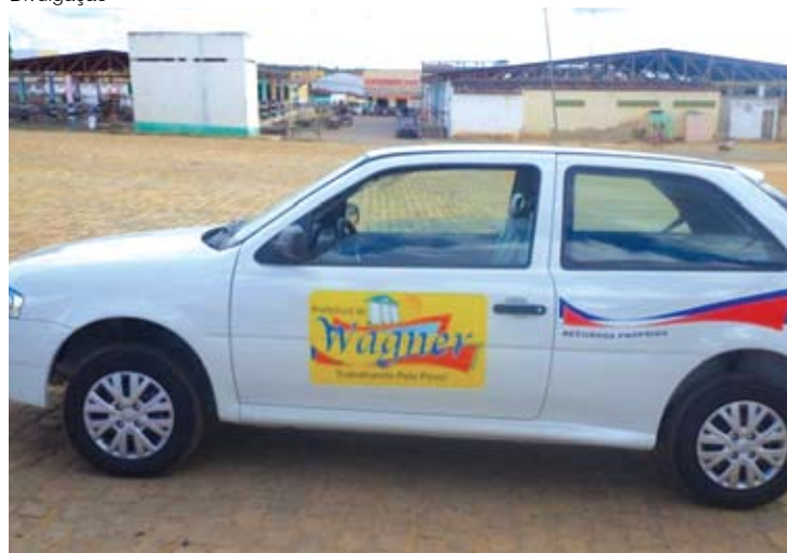
Secretaria de Saúde ganha carro novo para atender demanda

Família (PSF). As unidades reformadas são as do bairro Renovação, na sede do município, a do distrito de Cachoeirinha e a do povoado de Morrinhos. Vale lembrar que a prefeitura está construindo também um PSF, no Assentamento São Sebastião.