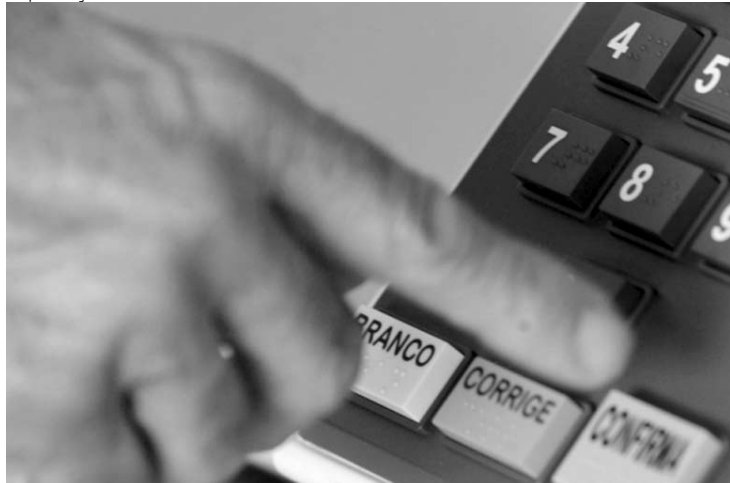
Campanha alerta o cidadão para data limite de regularizar o título

De olho na participação dos jovens de 16 e 17 anos, cujo voto é facultativo, o Tribunal Superior Eleitoral (TSE) decidiu lançar campanha em rádio e televisão, voltada para eles, nas próximas eleições. Com a intenção de lembrar a esses eleitores da