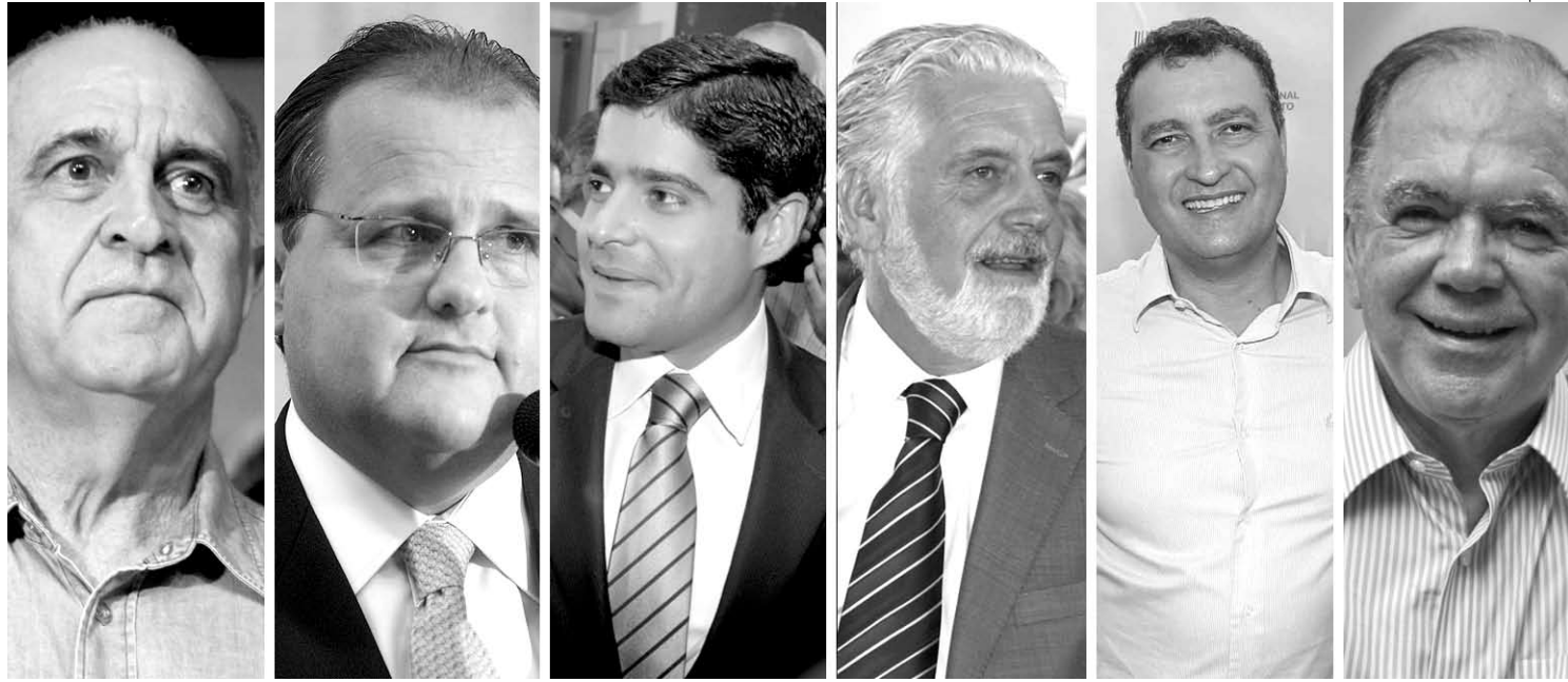
Políticos armam estratégias para a campanha eleitoral que já começou na capital e no interior antes mesmo das decisões das chapas

Atualmente, o prefeito da capital é visto como a força motriz da oposição, que carrega