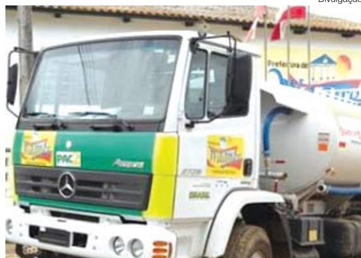
Carro-pipa foi adquirido por meio do PAC 2 do governo federal

A prefeitura de Wagner está na expectativa de entregar as 40 casas que estão sendo construídas no bairro Renovação 3, durante a 30ª Festa dos Vaqueiros, que será realizada